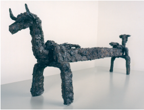
Capfoguier de ferro, s. IV-III aC

reconstruïda (vegeu rètol 6 de l'itinerari) Al segle IV aC aquest espai era ocupat per dues cases de forma rectangular, sota el terra d'una de les quals s'hi enterrà un nounat, pràctica habitual en el món iber lligada als rituals de fecunditat i prosperitat. Al segle III aC, es va construir un habitatge de dimensions considerables. A la part davantera hi havia un espai distribuïdor i a la dreta un petit rebost. A través d'unes escales de pedra s'accedia a una gran habitació. Tenia una llar de foc central i un altell fet amb fusta, on s'hi guardaven estibades àmfores ibèriques que contenien cervesa.