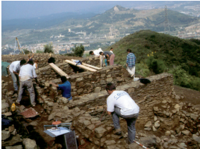
Tasques de consolidació 4 6