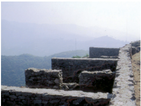
Carrer i habitatges restaurats 4 6