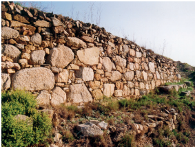
Mur del sistema defensiu 2

(vegeu rètols 5 i 7 de l'itinerari) El poblat presenta una estructura que podem qualificar d'urbana, ja que està organitzat en carrers on donen les cases. El sòl dels carrers estava format per una successió de capes de terra batuda. Actualment es coneix bé un carrer, molt estret, el qual amb un traçat circular recorre l'interior del poblat d'un extrem a l'altre. En un d'ells, té retallada a la roca una canal pel desguàs d'aigües fora del poblat.