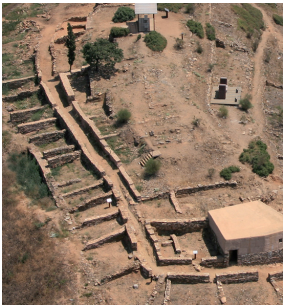
Vista aèria parcial 1 4 5 6 7