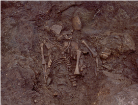
Enterrament infantil 5