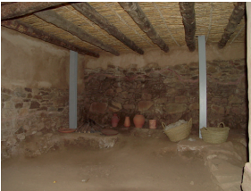
Interior de la casa reconstruïda 5 6