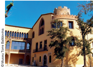
Edifici del Museu Torre Balldovina