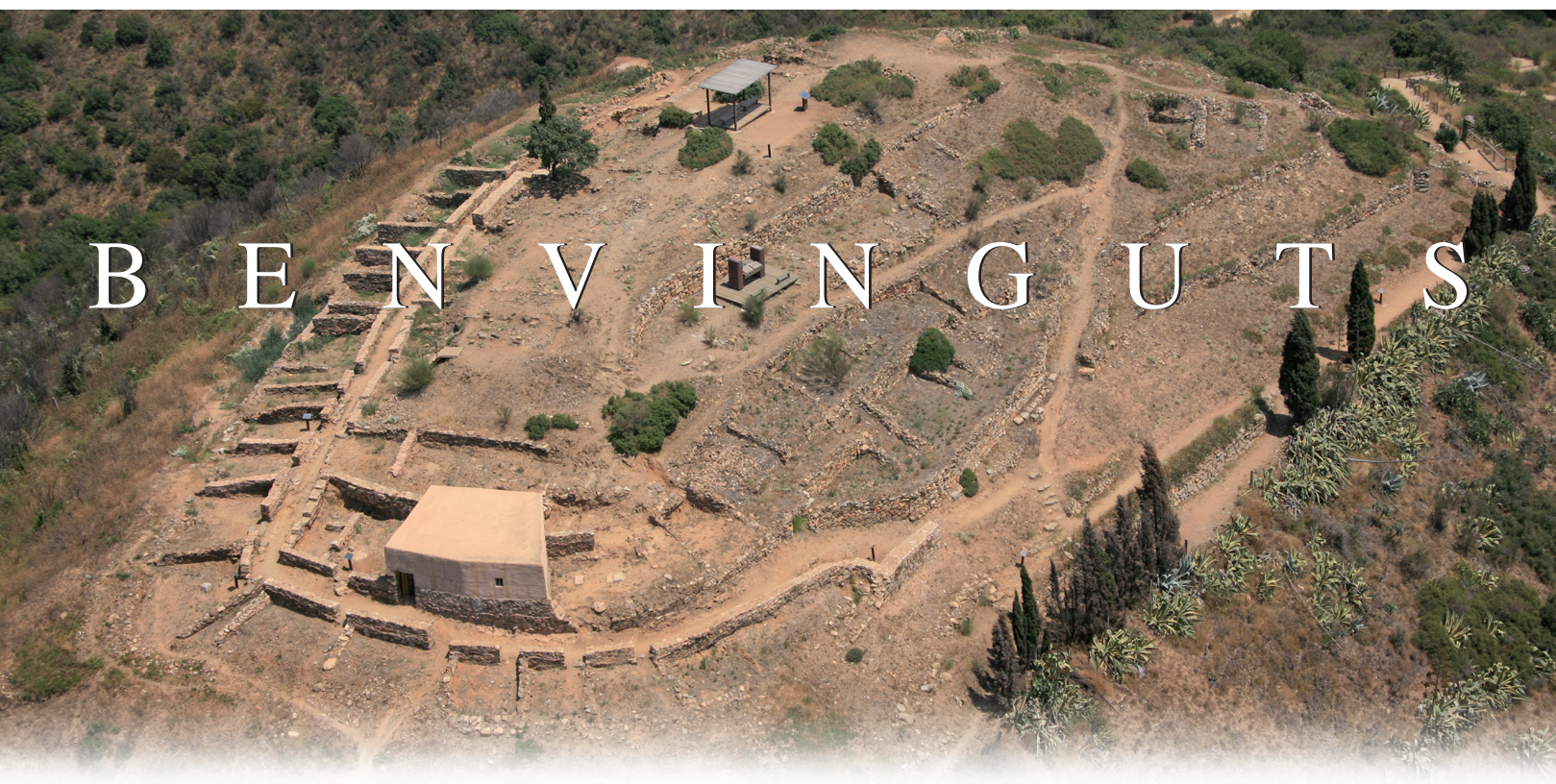
Vista aèria del jaciment Puig Castellar

Horari: Obert permanentment. Museu De dimarts a dissabte, de 18 a 20,30 h Dissabtes, diumenges i festius, d'11 a 14 h Juliol: De dimarts a dissabte, de 17 a 21 h Dilluns i mes d'agost, tancat. Per a més informació: Museu Torre Balldovina Plaça de Pau Casals, s/n Apartat de correus 62 08922 Santa Coloma de Gramenet (Barcelona) Tel. 933 85 71 42 Fax 934 66 09 74 www.gramenet.cat/museutorreballdovina museutorreballdovina@gramenet.cat